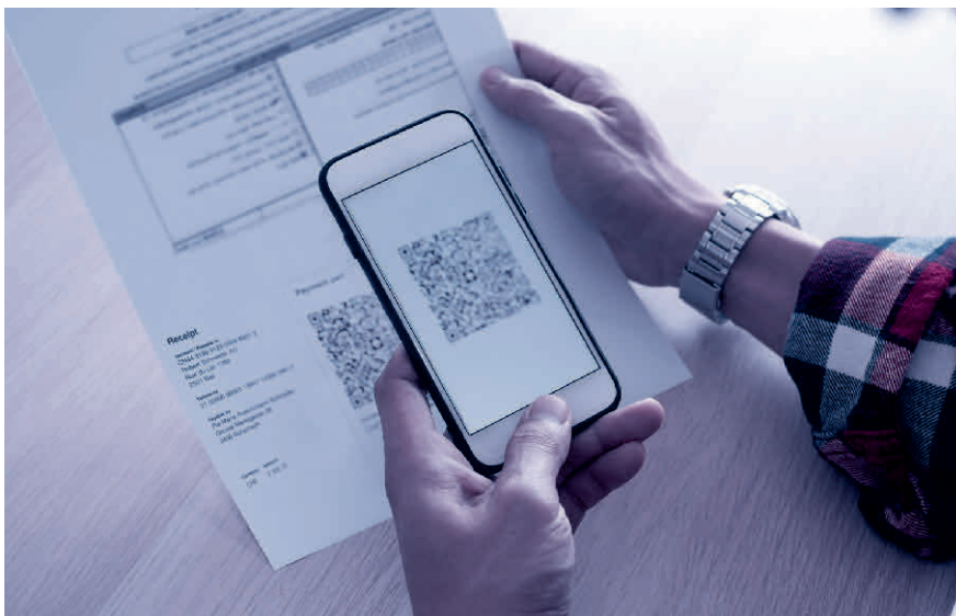
Scannen und fertig: Der QR-Code enthält alle relevanten Rechnungsdaten.

Lesen Sie mehr zum Thema im Blogbeitrag von TREUHAND|SUISSE unter www.treuhandswiss.ch/blog